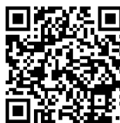
für iOS (Apple)-Smartphones und iPads